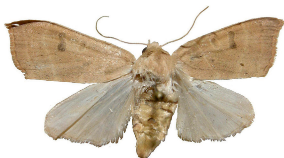
Рис. 1. Eugnorisma miniago (Freyer, 1839).

З поміж інших насамперед варто відзначити такі види, як: Eugnorisma miniago (рис. 1), що вперше зареєстрований в Україні, а його місцезнаходження є найбільш західним у його ареалі; а також Catocala lupina (рис. 2), що вдруге виявлений на території України.